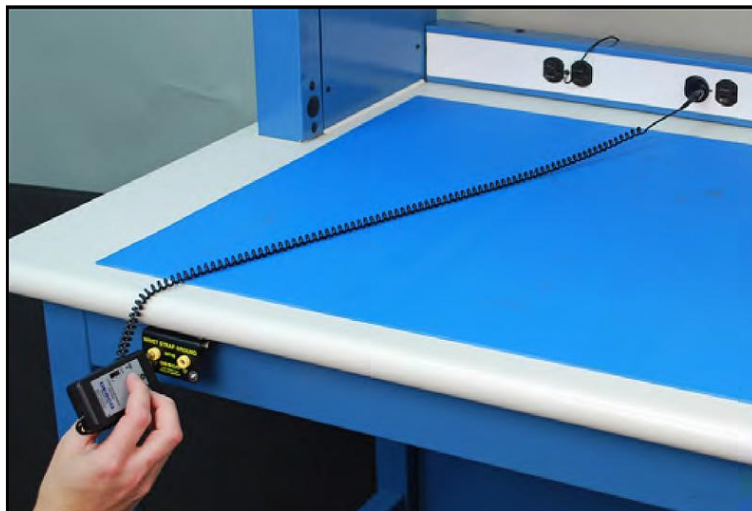
检测插孔类接地端子